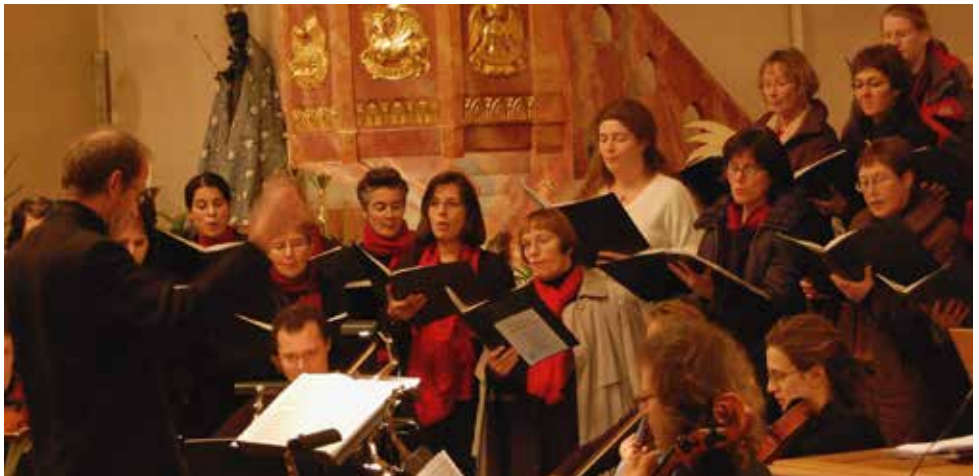
Kantorei der reformierten Stadtkirche Solothurn

Mit unbekanntem Meisterwerken des Barock entwickelt die Kantorei Solothurn ein farbenfrohes Weihnachtsoratorium. Nie spielte eine Stilepoche so virtuos mit Affekten und Gegensätzen wie das Zeitalter des Barock. Die ausgewählten Werke von Heinrich Schütz bis Georg Philipp Telemann, der flexible Chor und ein kleines Streichorchester sind die Grundlage für eine fröhliche, bunte und doch stimmungsvolle musikalische Weihnachtsfeier. Wie in seiner Zeit üblich, wird das im Zentrum stehende Magnificat des zur neapolitanischen Schule gehörenden Francesco Durante mit Advents- und Weihnachtsliedern ergänzt – und das Publikum ist zum Mitsingen eingeladen.